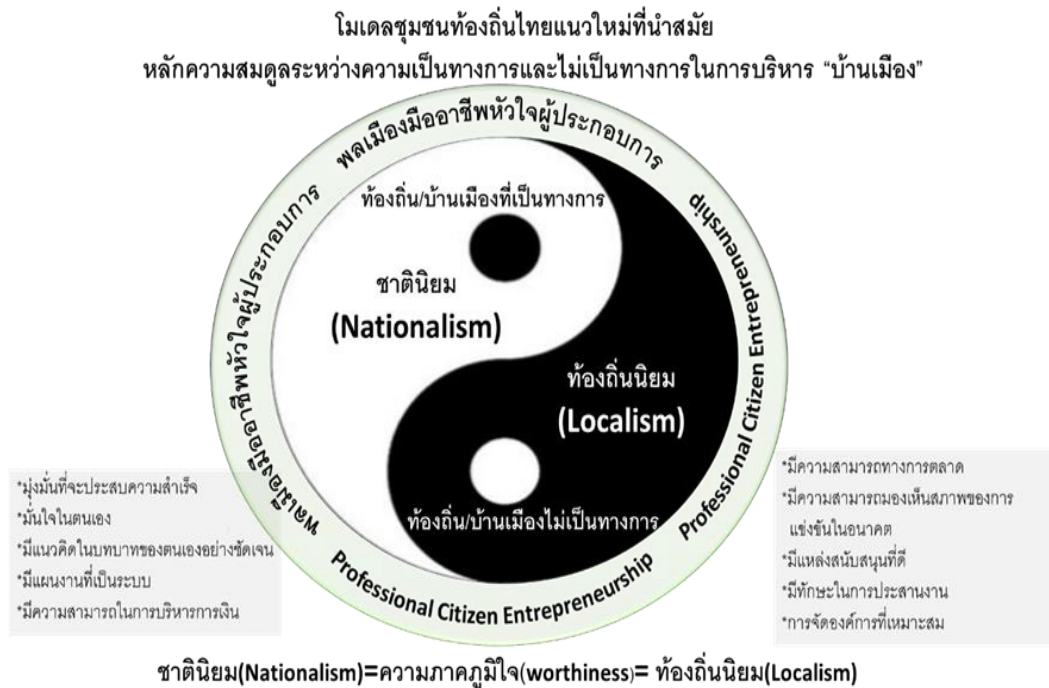
รูปที่ 1 แบบแผนชุมชนท้องถิ่นไทยแนวใหม่ที่นำเสนอภายใต้ความสมดุลระหว่างความเป็นทางการและไม่เป็นทางการ

“บ้านเมือง” ของเราเองด้วย เราจึงจะต้องมี “ความรัก” ต่อบ้านเมืองชุมชนท้องถิ่นของเรา ไม่ควรรีหุน้อยไปกว่าความรักชาติ จะต้องสร้าง “ท้องถิ่นนิยม” (Localism) ขึ้นมา คู่ไปกับ “ชาตินิยม” (Nationalism) ต้องภาคภูมิใจในท้องถิ่นไม่ยิ่งหย่อนไปกว่าความภาคภูมิใจในชาติ ซึ่งอธิบายความผสมผสานระหว่างการปกครองและการบริหารบ้านเมืองที่เป็นทางการกับไม่เป็นทางการด้วยแผนภาพดังนี้