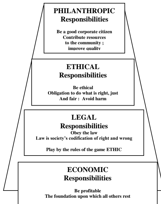
แผนภาพที่ 2: ทฤษฎี ด้าน CS: The Pyramid of Corporate Social Responsibility