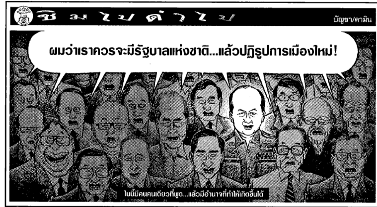
ภาพ 13 พลเอกอนุพงษ์ เผ่าจินดา กับนักการเมือง

นอกจากบัญชา คามิน จะได้สร้างความชอบธรรมให้แก่กลุ่มพันธมิตรประชาชนเพื่อประชาธิปไตย แล้ว เขายังได้สนับสนุนทหารในการจัดการความขัดแย้งทางการเมืองที่เกิดขึ้นด้วย