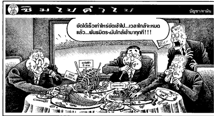
ภาพ 5 นายสมัคร สุนทรเวชกับคณะรัฐมนตรีรับประทานอาหาร

การกระทำของรัฐบาลจึงเป็นการย่ำยีรัฐธรรมนูญ หากพิจารณาประกอบคำพูดของนายสมัครที่ว่า “...แลกกับเวลาพวกผมเรียงควายนั่น อย่าออกมาขวางแค่นั้นแหละ” คำพูดนี้แสดงว่า บัญชา คามินวิจารณ์นโยบายประชานิยมที่ใช้เพื่อยืดเวลาการปิดเป็นรัฐธรรมนูญโดยไม่ได้ก่อให้เกิดผลประโยชน์ให้แก่ส่วนรวมแต่อย่างใด