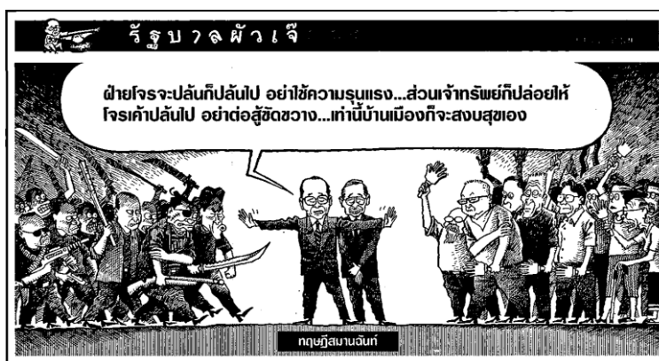
ภาพ 10 การเผชิญหน้าระหว่างสองกลุ่มการเมือง