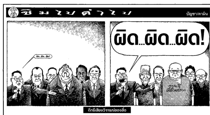
ภาพ 11 รัฐบาลนายสมัคร สุนทรเวชกับกลุ่มพันธมิตรประชาชนเพื่อประชาธิปไตย

การใช้อุปลักษณ์ในภาพนี้คือการเปรียบเทียบความขัดแย้งระหว่างกลุ่มการเมือง เป็นเสมือนความสัมพันธ์ระหว่างเจ้าทรัพย์กับโจร มีกลุ่มพันธมิตรประชาชนเพื่อประชาธิปไตยแทนเจ้าทรัพย์ กลุ่มแนวร่วมประชาธิปไตยต่อต้านเผด็จการเปรียบแทนโจร การสร้างความชอบธรรมให้แก่กลุ่มพันธมิตรประชาชนเพื่อประชาธิปไตยผู้มีสถานะเป็นเจ้าทรัพย์ ได้แก่ ประชาธิปไตย ประเทศชาติ และความถูกต้อง นักเขียนวาดภาพกลุ่มคนหลากหลาย ได้แก่ ผู้ชาย ผู้หญิง คนสูงอายุ ผู้ใช้มือตบเป็นเครื่องมือในการประท้วง เพื่อแสดงถึงการชุมนุมด้วยความสงบ แตกต่างกับกลุ่มแนวร่วมประชาธิปไตยต่อต้านเผด็จการ ที่ถูกเปรียบเป็นโจรผู้ขโมยทรัพย์ของผู้อื่น ในที่นี้คือ การแย่งชิงประชาธิปไตยและประเทศชาติ โดยใช้วิธีโจรกรรมอย่างโหดร้าย สืบเนื่องจากการที่บัญชา คามิน วาดภาพให้กลุ่มนี้เป็นผู้ชายทั้งหมด หน้าตาเต็มไปด้วยริ้วรอย มีอาวุธอยู่ในมือ เป็นการสร้างความชอบธรรมให้แก่กลุ่มพันธมิตรประชาชนเพื่อประชาธิปไตยผู้เป็นเจ้าของประเทศชาติ รักสงบ ยึดถือประชาธิปไตย ในขณะที่กลุ่มแนวร่วมประชาธิปไตยต่อต้านเผด็จการเป็นผู้ชุมนุมที่โหดร้าย