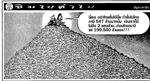
ภาพ 6 นายทักซิณ ชินวัตรและภรรยา นั่งบนกองเงิน