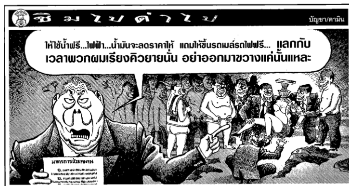
ภาพ 4 นายสมัคร สุนทรเวชประกาศนโยบาย และนักการเมืองชิมช้อปรัฐธรรมนุญ

อุปมาอุปไมย (Metaphor) หมายถึง “ภาพพจน์ที่นำเอาสิ่งที่ต่างกัน 2 สิ่งหรือมากกว่า แต่มีคุณสมบัติบางประการร่วมกันมาเปรียบเทียบกัน โดยเปรียบเทียบว่าสิ่งหนึ่งเป็นอีกสิ่งหนึ่งโดยตรง” (ราชบัณฑิตยสถาน, 2545: 261) บัญชา คามิน ใช้อุปมาอุปไมยในการนำเสนอความเลวร้ายของนโยบายประชานิยมและการทุจริต