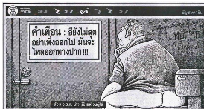
ภาพ 2 นายสมัคร สุนทรเวชอยู่ในห้องน้ำ