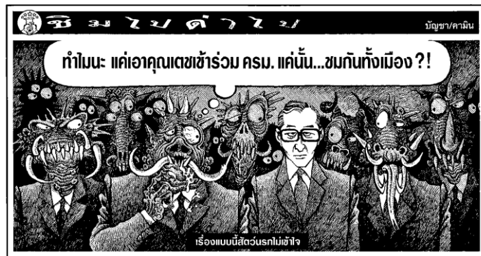
ภาพ 3 นายเตช บุณนาคกับคณะรัฐมนตรี