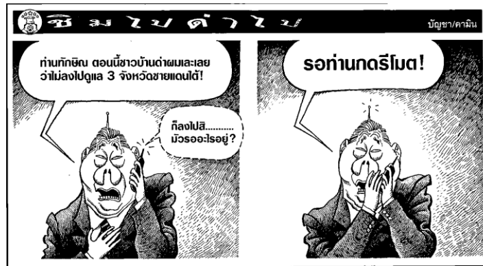
ภาพ 9 นายสมักร สุนทรเวชคุยโทรศัพท์กับนายทักษิณ ชินวัตร

(ที่มา: ผู้จัดการรายวัน ฉบับวันที่ 20 มีนาคม 2551)