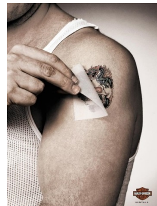
รูปที่ 3 “Rentals”