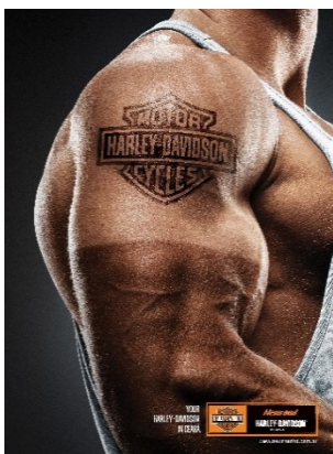
รูปที่ 1 “New Road”

การวิจัยครั้งนี้เป็นการวิจัยเชิงคุณภาพโดยมีระเบียบวิธีวิจัยดังนี้ 1) การวิเคราะห์ด้วยทเพื่อเข้าใจถึงเนื้อหาและวิธีการสร้างความหมายของความเป็นชายในงานโฆษณา โดยสำรวจรูปภาพโฆษณาในเว็บไซต์อย่างเป็นทางการ (Official Website) ของสินค้าได้แก่ www.harley-davidson.com และเว็บไซต์ที่เกี่ยวข้องกับธุรกิจโฆษณาที่ทำการสืบค้นในช่วงตั้งแต่เดือนกรกฎาคม-กันยายน 2558 2) คัดเลือกภาพอย่างเฉพาะเจาะจงจำนวน 3 ชุดภาพเพื่อนำมาวิเคราะห์ โดยเกณฑ์การคัดเลือกนั้น ลายสักของบุคคลที่ปรากฏบนรูปภาพโฆษณาจะต้องถูกวางอยู่ในองค์ประกอบที่เป็นระยะชัดเจนและอยู่ในตำแหน่งที่เป็นจุดสนใจของประธานภาพ 3) การวิเคราะห์ด้วยทนั้นผู้วิจัยใช้แนวคิดเรื่องอุดมการณ์ความเป็นชาย ทฤษฎีเรือนร่าง แนวคิดเรื่องลายสัก การตีความเชิงสัญลักษณ์วิทยาและสารแฝงในโฆษณา มาเป็นกรอบในการวิเคราะห์