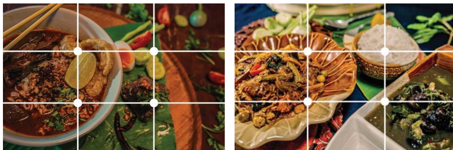
ภาพที่ 12 : อาหาร จัดองค์ประกอบภาพแบบ จุดตัดเก้าช่อง ที่มา : พุฒิพงศ์ จันทร์แสง