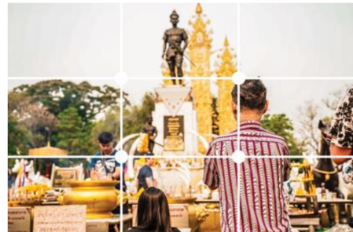
ภาพที่ 8 : วัฒนธรรมประเพณี จัดองค์ประกอบภาพแบบจุดตัดเก้าช่อง ที่มา : พุฒิพงศ์ จันทร์แสง