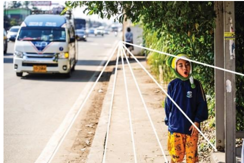
ภาพที่ 7 : การคมนาคม จัดองค์ประกอบแบบเส้นนำสายตา