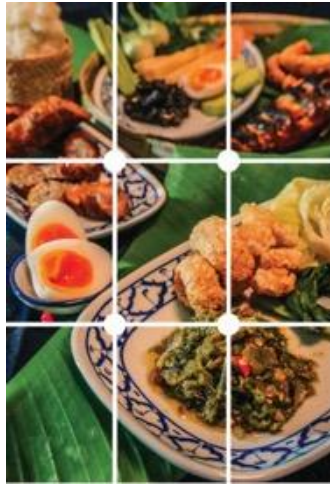
ภาพที่ 13 : อาหาร จัดองค์ประกอบภาพแบบ จุดตัดเก้าช่อง ที่มา : พุดพิงศ์ จันทร์แสง

จากการคัดเลือกภาพถ่ายสารคดีที่สื่อสาร สะท้อนอารมณ์และความรู้สึก เรื่องราวคนเมืองเชียงรายโดยผู้เชี่ยวชาญ ได้หัวข้อละ 20 ภาพ นำมาจัดทำ photobook โดยแสดงหลักการจัดองค์ประกอบภาพ เพื่อให้ผู้อ่านที่เป็นกลุ่มเป้าหมายสามารถเข้าใจง่าย เรียนรู้หลักการจัดองค์ประกอบภาพที่ใช้กับภาพถ่ายสารคดี ดังนี้