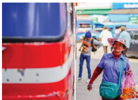
ภาพที่ 6 : การคมนาคม จัดองค์ประกอบแบบสมดุลแบบอสมมาตร ที่มา : พุฒิพงษ์ จันทรแสง