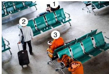
ภาพที่ 5 : การคมนาคม จัดองค์ประกอบแบบจำนวนส่วนประกอบในภาพเป็นเลขคู่