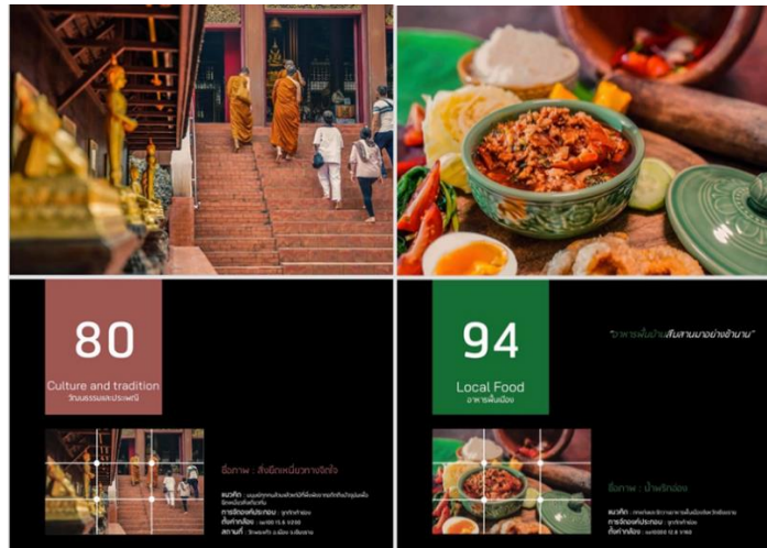
ภาพที่ 14 แสดงการจัด Lay Out ในหนังสือภาพถ่ายสารคดี ที่สื่อสารเรื่องราวคนเมืองเชียงราย