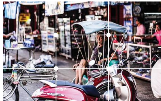
ภาพที่ 2 : วิถีชีวิต จัดองค์ประกอบภาพแบบจุดตัดเก้าช่อง