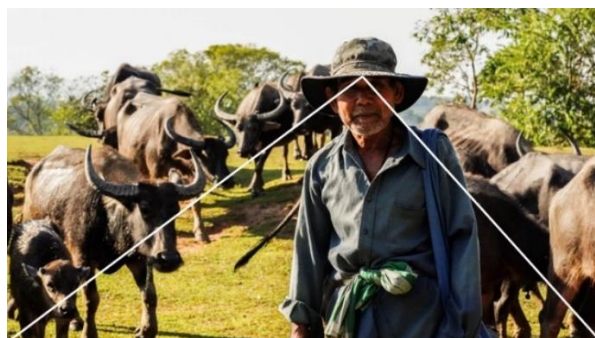
ภาพที่ 3 : วิถีชีวิต จัดองค์ประกอบภาพแบบเส้นนำสายตา