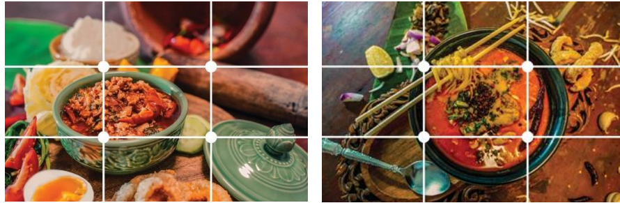
ภาพที่ 11 : อาหาร จัดองค์ประกอบภาพแบบ จุดตัดเก้าช่อง