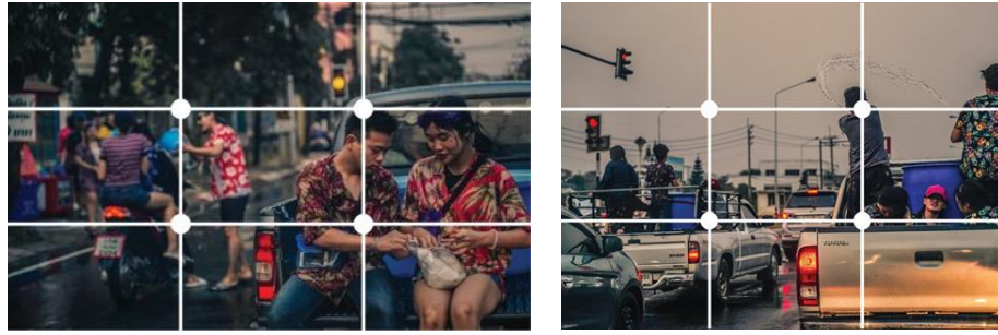
ภาพที่ 10 : วัฒนธรรมประเพณี จัดองค์ประกอบภาพแบบจุดตัดเก้าช่อง