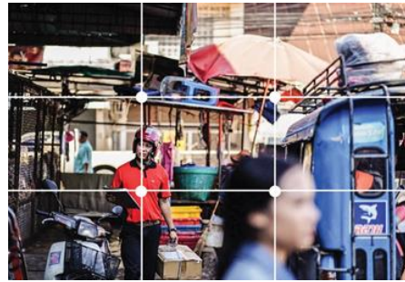
รูปที่ 1 : วิถีชีวิต จัดองค์ประกอบภาพแบบจุดตัดเก้าช่อง