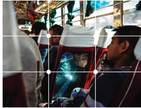
ภาพที่ 4 : การคมนาคม จัดองค์ประกอบภาพแบบจุดตัดเก้าช่อง