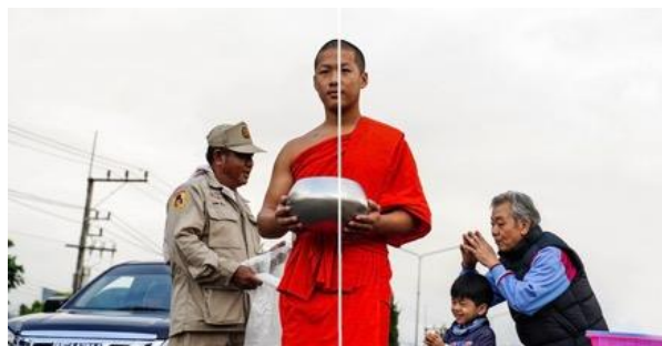
ภาพที่ 9 : วัฒนธรรมประเพณี จัดองค์ประกอบภาพแบบอสมมาตร