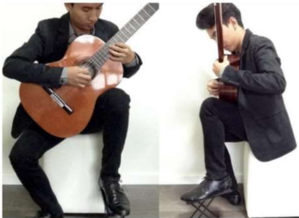
รูปที่ 4.1 ภาพการจัดองค์ประกอบร่างกายและกีตาร์ให้เหมาะกับการบรรเลง (ศุภพรพงศ์, 2566)