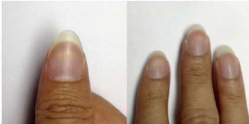
รูปที่ 5.1 ภาพลักษณะการทำเล็บมือข้างขวาของผู้วิจัย (ศุภพรพงศ์, 2566)

อีกหนึ่งปัจจัยในการบรรเลงกีตาร์ของนักกีตาร์คลาสสิกคือ การทำเล็บมือข้างขวา โดยตัวผู้วิจัยเริ่มด้วยการใช้ ตะไบเล็บแบบละเอียดเพื่อขัดสิ่งสกปรกออกจากเล็บและแต่งมุมของเล็บ ซึ่งช่วยให้การติดด้วยเล็บไม่ติดขัดและได้คุณภาพของเสียงดังที่ต้องการ หลังจากนั้นให้ใช้กระดาษทราย สำหรับนักกีตาร์คลาสสิกตะไบและเก็บมุมเล็บตามลำดับขนาดของกระดาษทราย เมื่อทำตามขั้นตอนแล้วเสร็จจะได้รูปแบบดังรูปภาพที่ 5.1