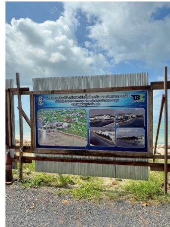
ภาพที่ 2 แสดงป้ายโครงการการก่อสร้างกำแพงกันคลื่น