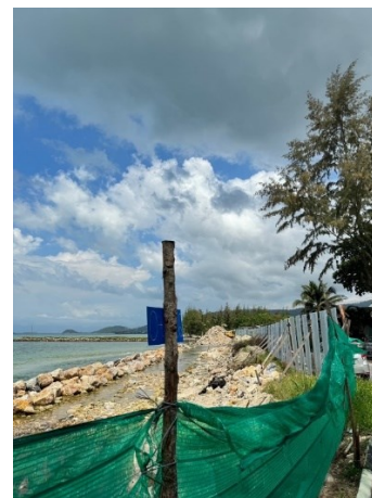
ภาพที่ 3 แสดงเขื่อนป้องกันการกัดเซาะชายฝั่ง หรือกำแพงกันคลื่น

วัตถุประสงค์ข้อที่ 2 : เพื่อศึกษาแนวทางในการแก้ไขปัญหาของความขัดแย้งด้านการจัดการทรัพยากรพื้นที่ชายหาดระหว่างหน่วยงานของรัฐกับชุมชนในอำเภอเกาะสมุย จังหวัดสุราษฎร์ธานี สรุปผลการศึกษาพบว่า จากปัญหาความขัดแย้งด้านการจัดการทรัพยากรพื้นที่ชายหาดที่เกิดขึ้นในชุมชนแนวทางที่จะสามารถแก้ไขปัญหาที่เกิดขึ้นได้นั้น (ผู้ให้ข้อมูลสำคัญท่านที่ 3, การสื่อสารส่วนบุคคล, 27 ตุลาคม 2566)