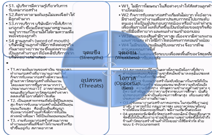
รูปที่ 3 : Swot analysis

แนวทางการจัดการด้านกลยุทธ์ธุรกิจรับเหมาก่อสร้างกรณีศึกษา ห้างหุ้นส่วนจำกัด YYY